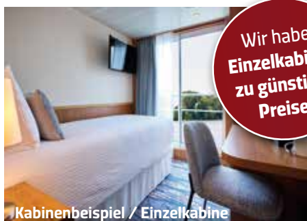
Kabinenbeispiel / Einzelkabine

Wir haben Einzelkabinen zu günstigen Preisen