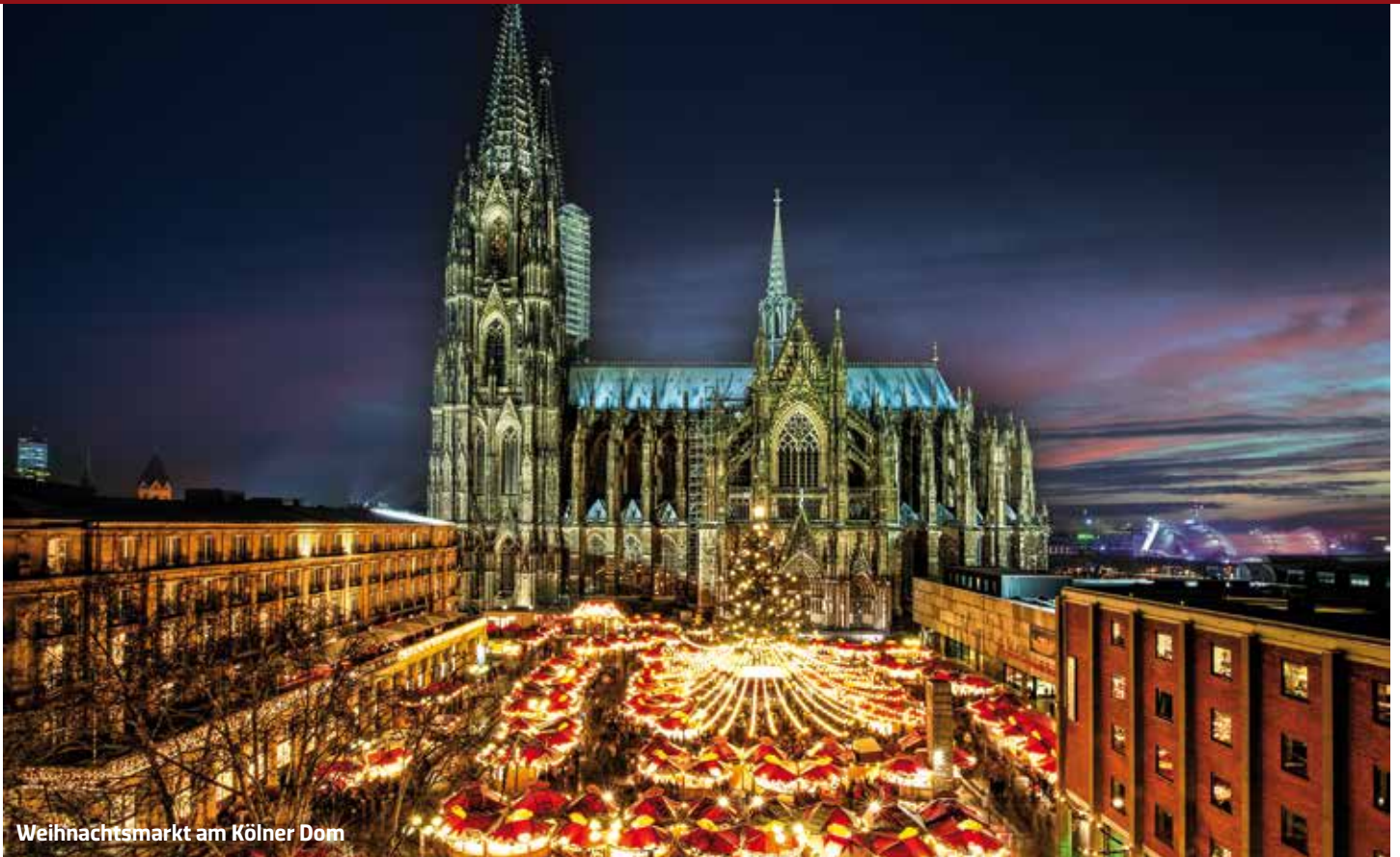
Weihnachtsmarkt am Kölner Dom

Ein Erlebnis der besonderen Art! Geniessen Sie den Advent und besuchen Sie mit uns die schönsten Weihnachtsmärkte entlang des Rheins und der Mosel!