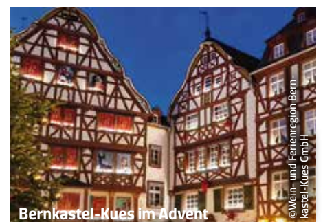
Bernkastel-Kues im Advent