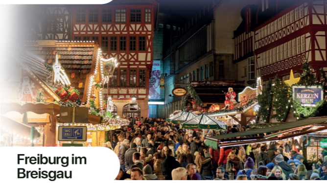
Freiburg im Breisgau